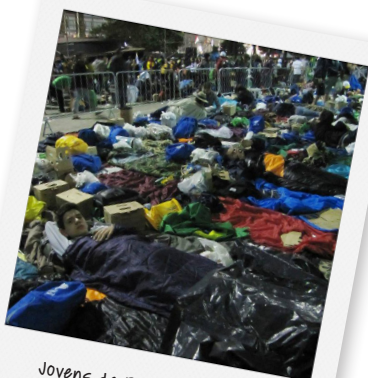
Jovens da PNSE hospedados no calçadão de Copacabana

“Que graça é estar com Pedro! Poder ver concretamente quão grandiosa e diversa é a maior obra de Cristo: a Igreja Católica. Qualquer tempo parece curto para viver esse céu na terra que é a experiência de uma peregrinação: estar com os irmãos da paróquia e conhecê-los melhor; ouvir uma infinidade de palavras fortes; experimentar a liberdade de viver na obediência, de sair das próprias vontades e de se abandonar um pouco na vontade do Senhor. No fim, a JMJ teve, para nós, a duração de três semanas; uma no Rio de Janeiro e duas vividas aqui mesmo na Paróquia, antes e depois, em meio a danças, cantos e experiências dos irmãos que vieram de fora para trazer vida nova à nossa comunidade. Bendito seja o Senhor, porque faz bem todas as coisas!”