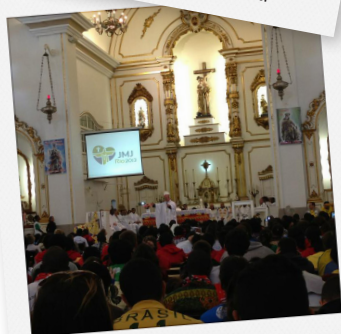
Catequese com Bispo João Bosco, em Niterói