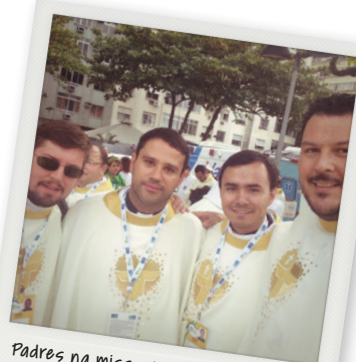
Padres na missa de envio com o Papa, em Copacabana