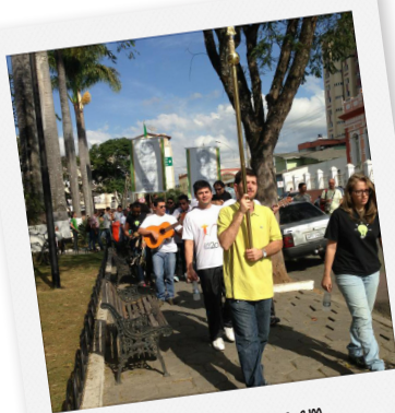
Anúncio nas ruas em Santo Antônio do Monte - MG