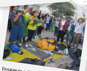
Ensaio do Flash mob em Copacabana