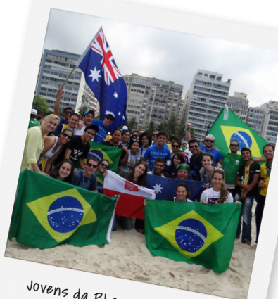
Jovens da RJ com australianos em Copacabana