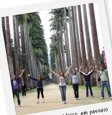
PJ no Jardim Botânico, em passeio pós JMJ