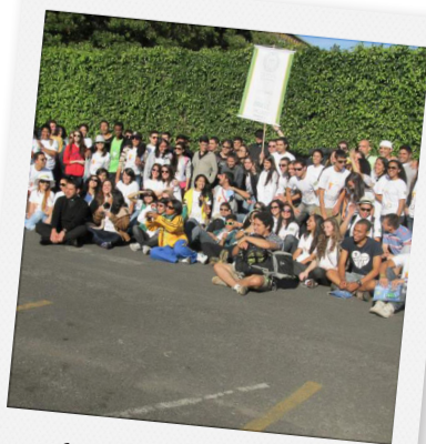
Grupo partindo em caravana

“Eu tinha planos para essa JMJ. Planos em grupo e planos individuais. Tinha uma preocupação com minha saúde. Não sabia se daria conta de tudo, mas sempre me colocava em oração: Senhor, que nessa jornada seja feita a Tua vontade, bem como é Tua vontade a minha participação nela! Ao final da jornada, só tenho a agradecer a Deus, pois só aconteceu o que foi da vontade Dele. Ainda estou na Graça Divina, com o coração agradecido por ter vida e saúde para ter ido até lá! Que tudo na minha vida seja para a honra e a glória de Deus!”