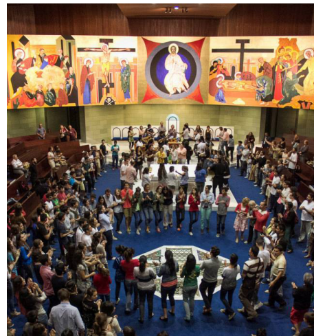
▲ Missa com peregrinos de Dallas - EUA e Barcelona - Espanha.

Foi emocionante ver a “Juventude do Papa” nas ruas. Nem mesmo os contratempos de organização e o cansaço do corpo fizeram cessar o meu desejo de continuar ali, escutando e