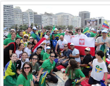
Jovens da RJ com peregrinos da Polônia, local da próxima JMJ

“Foi a primeira vez que participei de uma JMJ. Achei que seria muito cansativo e que eu não daria conta, mas depusitei minha confiança em Deus e fui. Pensei que ficaria sozinha, por não ter nenhum amigo no grupo. Mas o pessoal, na verdade, foi muito receptivo. Pra mim a maior emoção da Jornada foi receber a benção do Papa. Percebi o quanto é importante a preparação que se faz antes dela, pois o espírito precisava estar preparado para agir com paciência, animação e muita alegria diante dos contratempos. Já estou pensando na JMJ na Polônia! Depois de vivenciar uma, você tem vontade de não perder mais nenhuma. É um modo de avivar a fé, de perceber que ela é a mesma no mundo todo e que em todos os continentes temos irmãos em Cristo. Bendito seja o Senhor, porque faz bem todas as coisas!”